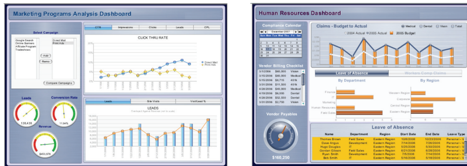
Mit Dashboards verschaffen Sie sich in Echtzeit den Überblick über Ihre Unternehmensperformance.

Heute ist das Umfeld eines Unternehmens ständig in Bewegung. Große Mengen von Geschäftsdaten verbergen sich in den Informationssilos komplizierter, inkonsistenter Datenbanken, auf die Fachwender nicht zugreifen und die von der IT-Abteilung nur mit Mühe in intuitive, grafische Präsentationen umgewandelt werden können.